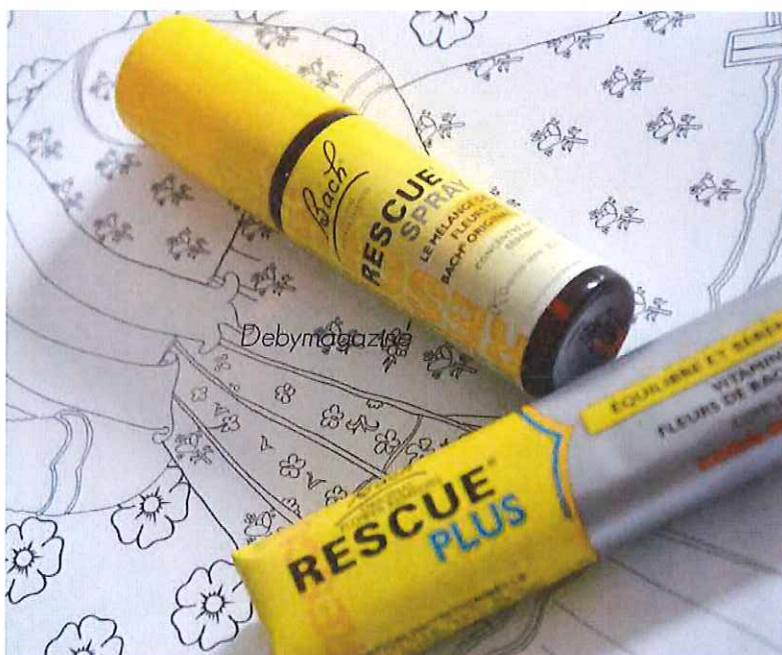
Fleurs de Bach : les 80 ans d'une partition florale - nouveauté

C'est donc un docteur anglais, Edward Bach, qui crée des formules en 1936 à partir de 38 fleurs qu'il avait sélectionnées de 1928 à 1935. Son credo était "que l'état d'esprit d'un individu jouait un rôle vital dans le maintien d'un état de bonne santé".