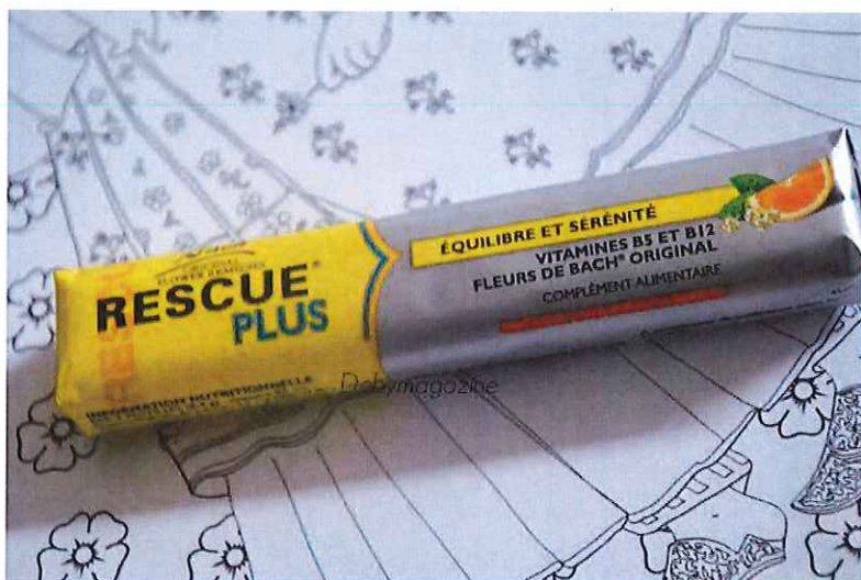
Fleurs de Bach : les 80 ans d'une partition florale - nouveauté

La gamme propose des pastilles avec une formule renforcée aux vitamines B5 et B12 bonnes pour l'esprit et le corps. La saveur orange-sureau plaira au plus grand nombre. A prendre deux fois par jour, ces pastilles sont un complément alimentaire et apporte 50 % de la valeur nutritionnelle de référence pour ces deux vitamines.